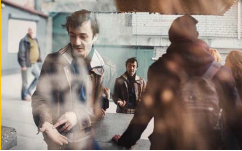
© Cie Les Amis de Franck Nogent